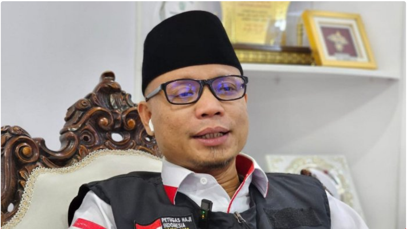
Ketua PPIH Arab Saudi

JEDDAH - Kementerian Agama menyiapkan asuransi jiwa bagi jemaah haji Indonesia yang wafat. Disiapkan juga asuransi bagi jemaah haji yang mengalami kecelakaan.